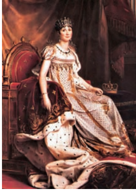
ジョセフィーヌ皇妃 エンパイアスタイル

ドレスのシルエットはエンパイアスタイル。ナポレオン皇妃であるジョセフィーヌが愛用し、19世紀に流行させたハイウエストのシュミーズドレスをイメージソースとした。