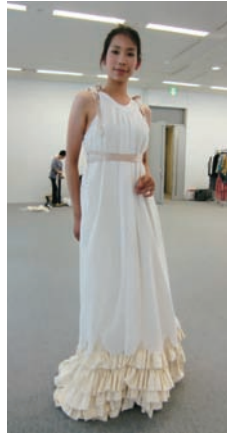
フロントデザイン