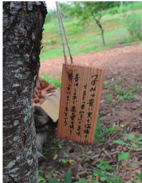
図2. “エピソード”を書き加えたネームプレート

添えたネームプレートを作成し、それぞれ観察路の樹木につけていく。草であれば、その傍にネームプレートを付けた杭を立てて観察や解説の手助けとする。観察ガイドブックの作製も有効である。保育者・教育者だけでなく子ども達も活動している時に自分でこれを読み、興味を抱くとともに日々慣れ親しむことでその植物の特性を熟知するようになる。